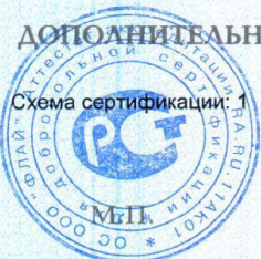
Схема сертификации: 1